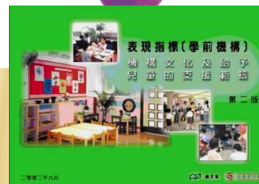
機構文化及 給予 兒童的支援