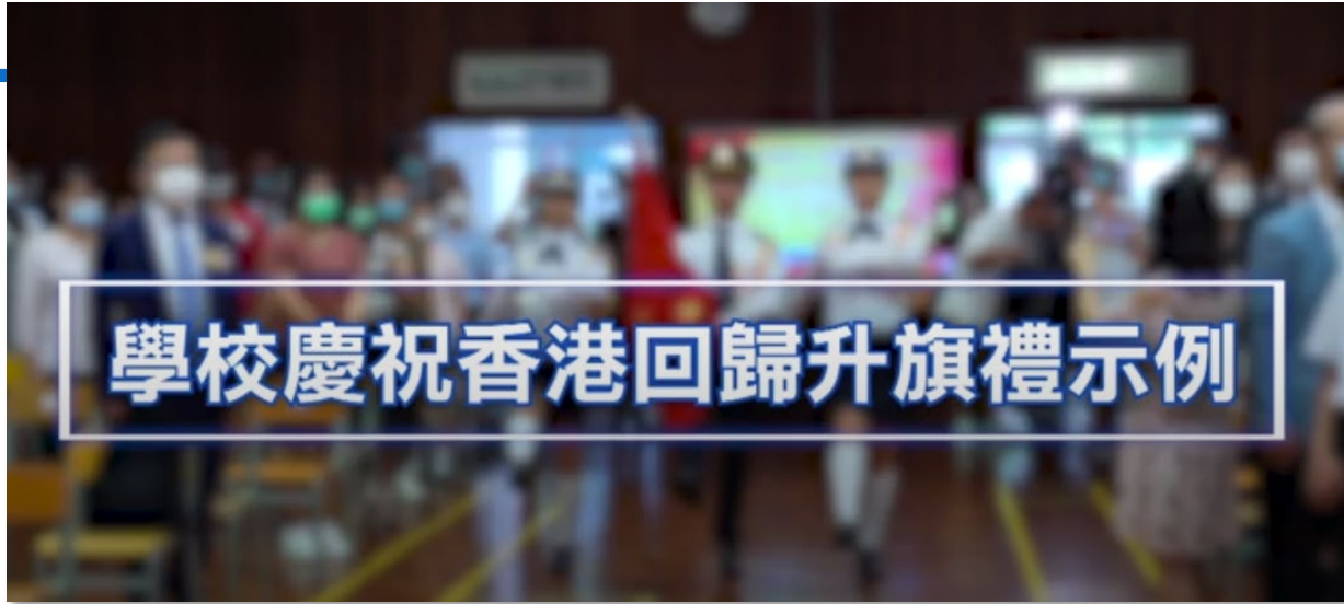
學校慶祝香港回歸升旗禮示例