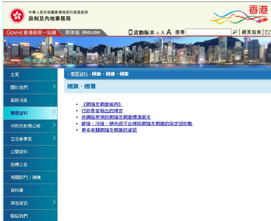
政制及內地事務局