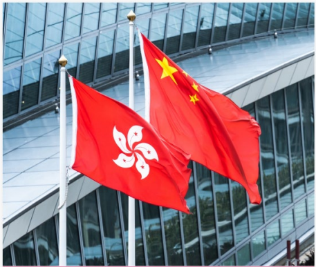
國旗、國徽、國歌、區旗及區徽