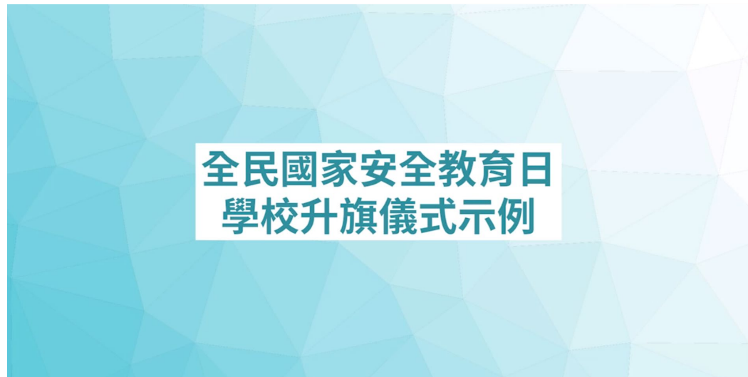
全民國家安全教育日 學校升旗禮示例