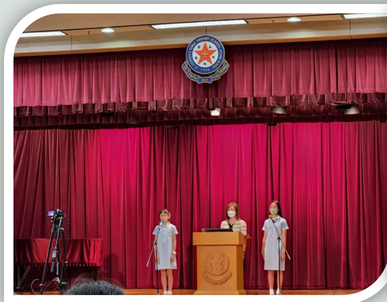
周副校長分享信息