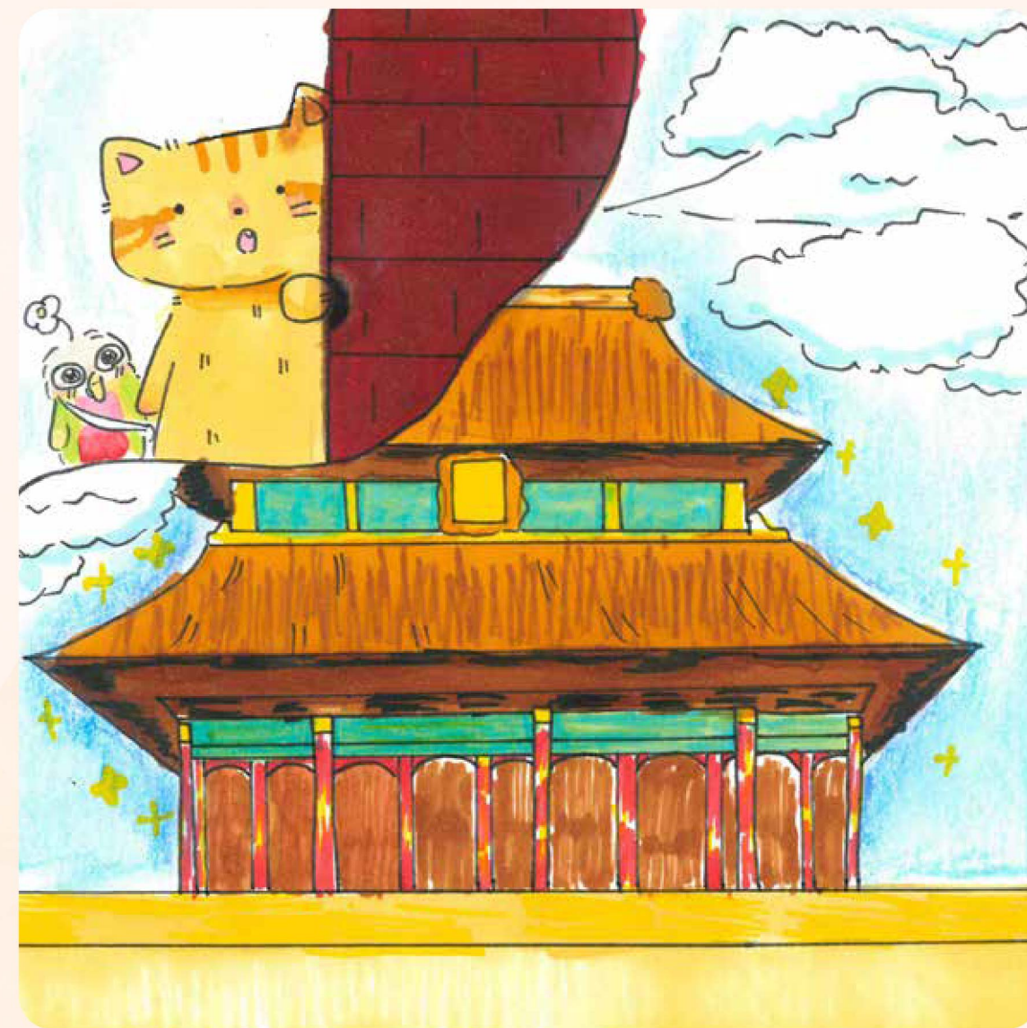
牠一看到眼前景物不禁驚訝地大叫：「故宮？」