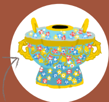
參考珍品：花卉紅火鍋 朝代：清代

教育局與香港故宮文化博物館合辦 香港故宮文化博物館珍品的故事 繪本創作比賽（小學）2023/24