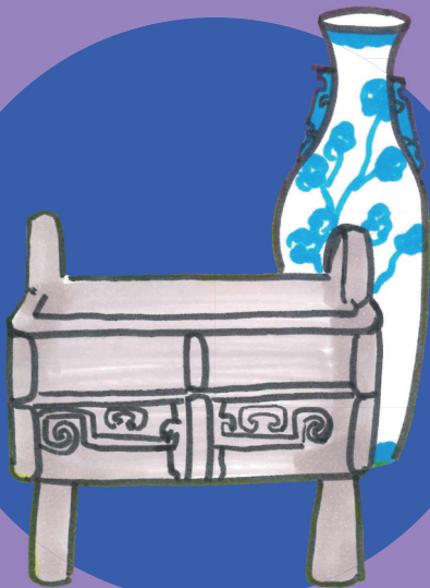
圖 / 文：吳子瑜 東華三院李賜豪小學