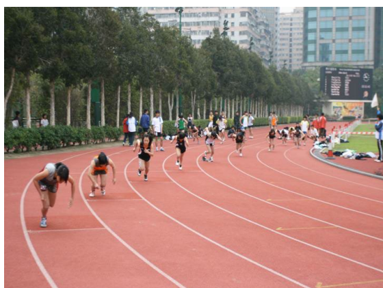
圖1.8 公共運動設施 – 運動場