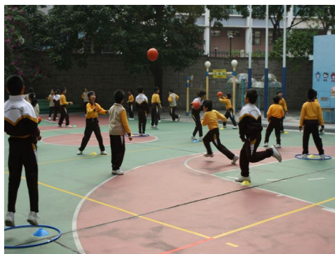
圖 1.1 學生進行體育活動，有助提升協作、創造、解決問題等共通能力。