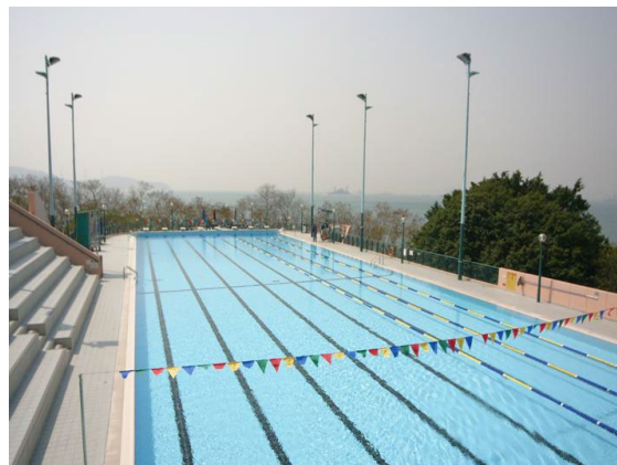
圖1.9 公共運動設施 – 游泳池