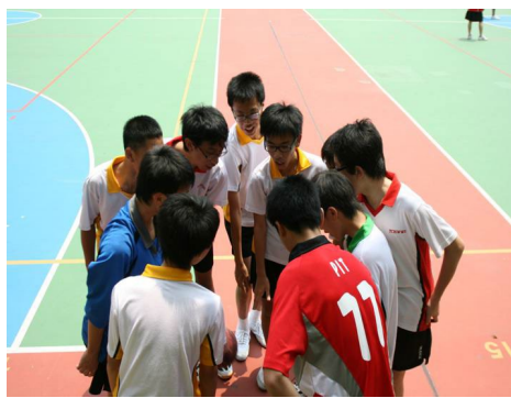
圖 1.2 學生參與聯課活動，有助提升社交能力和人際溝通技巧。