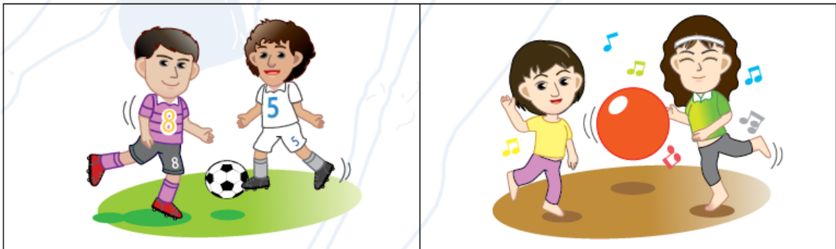
圖 8.2 男性和女性在選擇參與運動和康樂活動時有頗大的差異