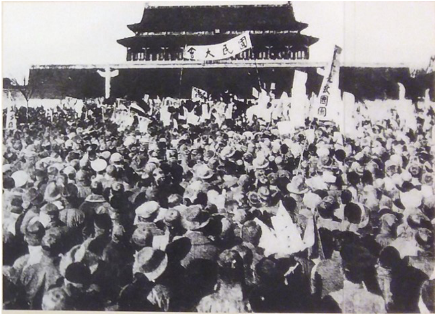
五四運動期間天安門集會

時畫既是五四運動發展的催化劑，也能作為記錄運動發展的史料，其內容讓人深刻反思「山東問題」，也可解釋新文化運動的緣起。1919年刊登於報章雜誌的時畫多以「山東問題」為主題，知識分子解釋時況，呼籲市民抵制日貨、罷工、罷市。時畫所描述的措施確實在五四運動中實現，可見民間團結，和應相關的提議。