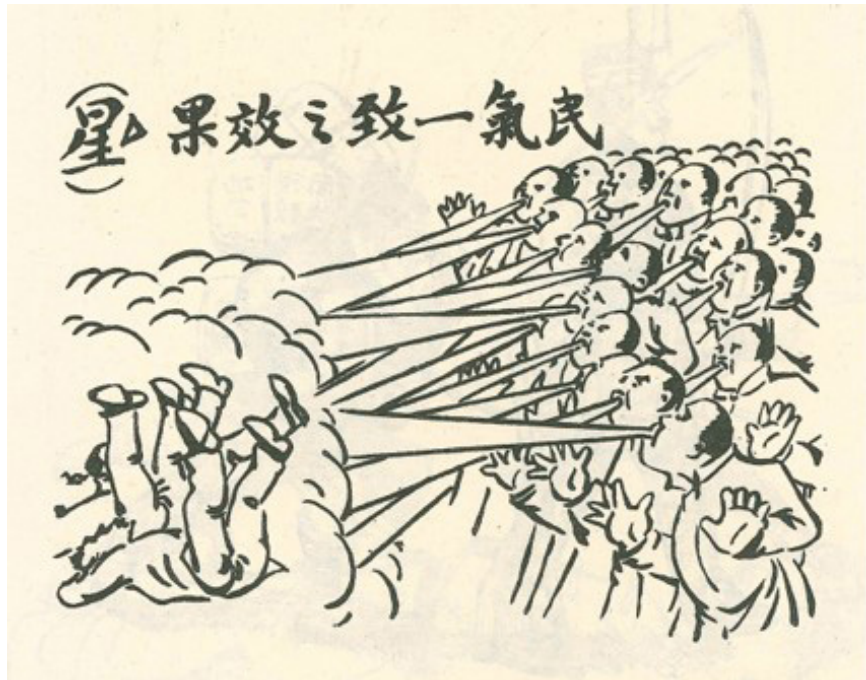
馬星馳〈民氣一致之效果〉