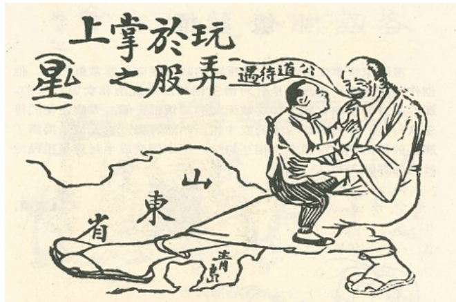
馬星馳〈玩弄於股掌之上〉