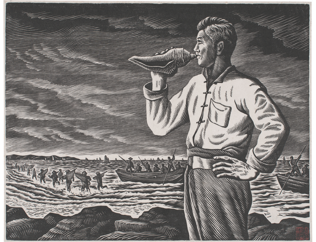
漁區之晨 Morning in a Fishing Village