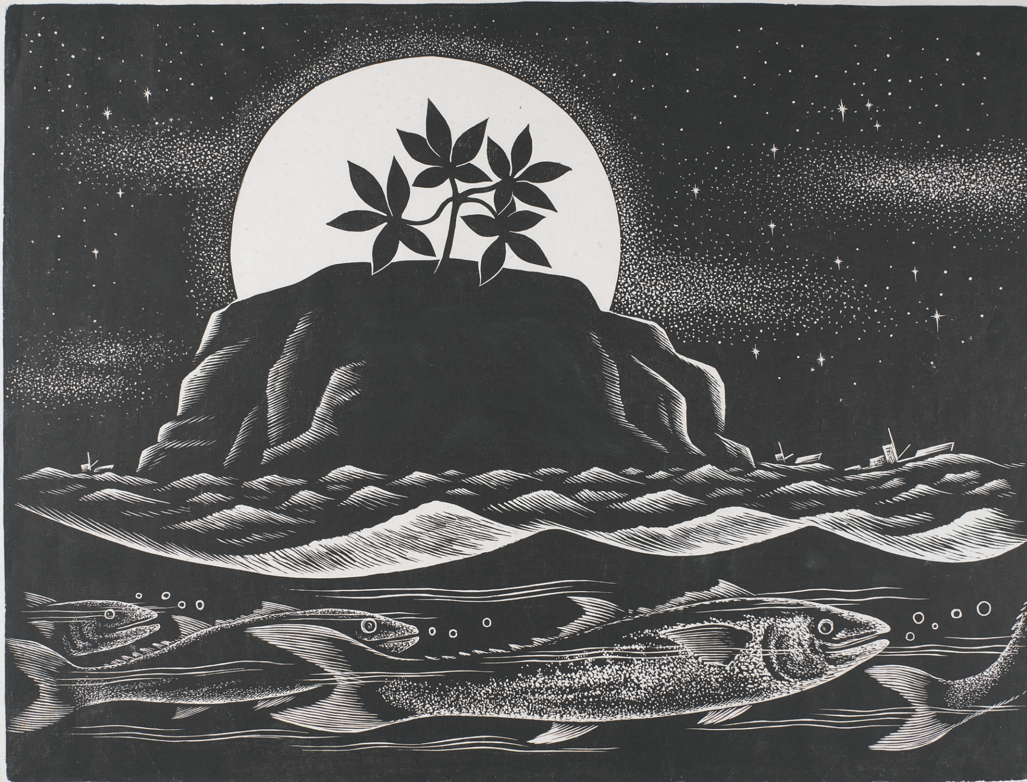
月夜棒樺島 Bangchui Island under the Moonlight