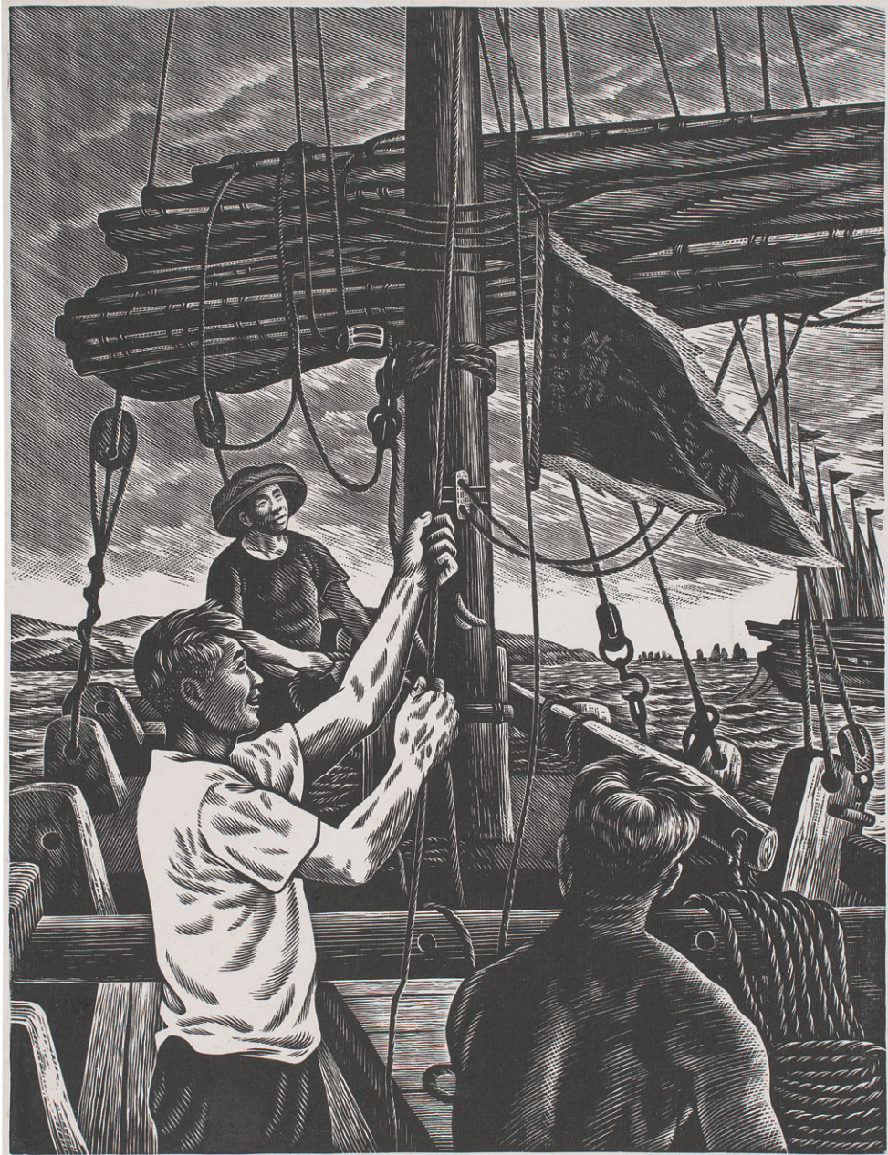
建社後第一次出海 (木刻)