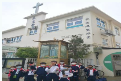
連繫課堂內外學習