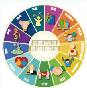
首要培育的學生價值觀和態度