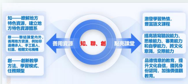
建構學校特色課程