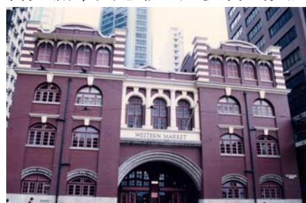
西港城（舊上環街市）

皆充滿中國色彩。只要得到更主動的推廣，定能向外界展現出香港獨有的一面，也是宣揚中國文化的一個好途徑。