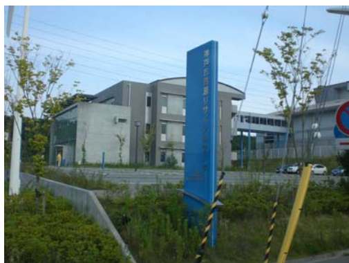
神戶資源回收中心

中小學課本，列為學生必修課，從小給孩子傳授環保憂患意識和節能環保理念。與此同時，日本社會還會通過建設環境教育館、環保俱樂部、編制通俗環保教材、成立環保民間組織等多種方式，以不同方法去提高公民環境意識。甚至連生態工業園、超級環保小鎮等環保設施聚集區，都成為環境教育基地供市民參觀、遊覽。