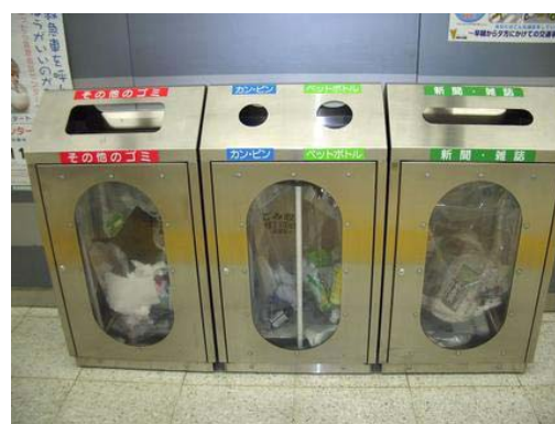
由左至右：其他垃圾、罐和樽、膠樽、報紙雜誌

由於日本不斷上升的廢物量已成為一大環境問題，所以日本整個社會都非常重視廢物回收一環，街頭上任何的垃圾箱都要分類。最重要的是，日本普及的環保教育，令到日本人無論在街頭上、學校、還是家居，都會自覺地將廢物分類及有系統地棄置。