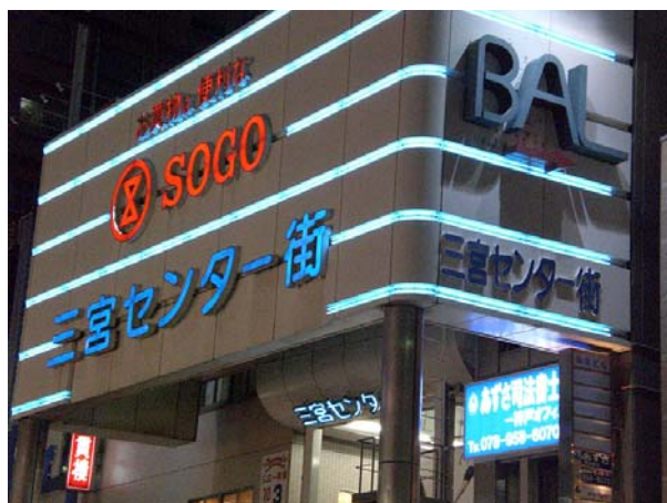
位於神戶的崇光百貨公司

政府以資本扶持工業與企業、強大的勞動力以及高科技的發展，幫助日本經濟高速發展，並成為當今世界上科技發達程度和經濟體規模都僅次於美國的經濟體。日本的經濟特點是生產商、供應商和經銷商的緊密結合；為加工型經濟；強大的企業聯盟；以及部分城市人口的終身就業保障。日本的經濟支柱為工業，需要倚賴進口的原材料和能源。而較小的農業則倚賴政府的補助與保護，日本的大米能夠自給自足，但其他農作物則須要進口。日本是全球最大的漁業國家之一。東京國際金融市場的作用正在擴大，日本正在朝金融大國化方向發展。