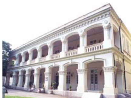
具有英國殖民地色彩的香港天文台

可是香港在文化保育方面顯得踟躕。其實早在 2000 年便有民間組織（長春社）向政府提出應關注景賢里的前途，立為古蹟，嚴禁進行任何工程，可是港政府卻沒有加以理會，最後致使景賢里受到無可補救的損害。