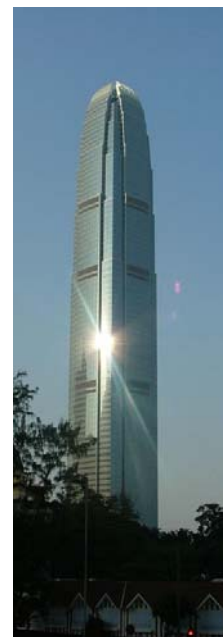
香港國際金融中心二期

政府一直堅持維持低稅率的政策，以鼓勵貿易和生產。與其他國家的稅率相比，香港稅項相對上比較優惠。此外，香港憑著一個沒有貿易障礙的免稅港、政府在經濟方面干預很少、極低通脹、資金流動及對外投資障礙極少、金融與銀行業限制極少、薪酬與價格干預很少、產權觀念牢固、維持低程度的規管以及非常規市場活動很少等的特點，積極不干預自由市場，為公平貿易提供一個良好的空間，成功吸引大量外資投入本港。而且高效率的物流服務包括擁有全球最繁忙的貨櫃港與最大貨櫃吞吐量及優秀的國際機場都對香港的未來作出貢獻。現時香港國際機場自 2001 年起連續五年獲榮為全球最佳機場。