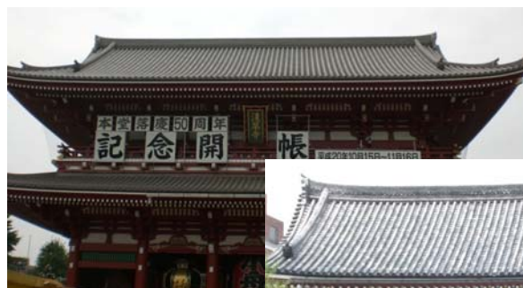
淺草寺及其入口雷門

香港能夠在旅遊業上持續創出佳績，更是 2006 年世界各城市的國際旅客中第五多，實是我們的光榮。我們做得好之餘，卻仍有一定的進步空間。憑著我們這次日本之旅，我們正領會到香港原來有一點正可將我們旅遊業推至更高峰，而尚未得到高度的重視 — 文物與環境之美。