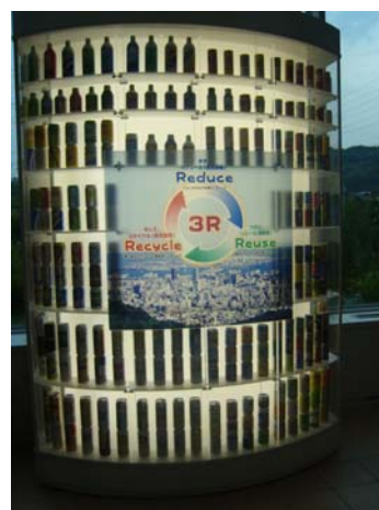
可回收再用的塑膠瓶

日本的各種包裝幾乎都會載明丟棄的類別，塑膠套也有便於撕開的設計，牛奶盒也圖示教大家該剪成何種形狀，最重要的是，所有日本人都會照著指示去正確丟棄廢物。由此可見，他們的自覺性、服從性及對社會的責任感是非常高。